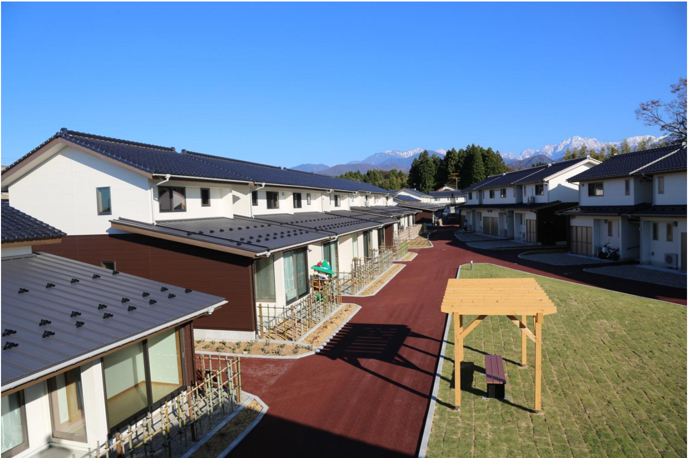
▲ 景観に配慮して、団地内の電線を地中化。劔岳を始めとする立山連邦の四季の移ろいが楽しめる