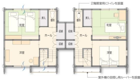
2LDK2階平面図 縮尺 1:100