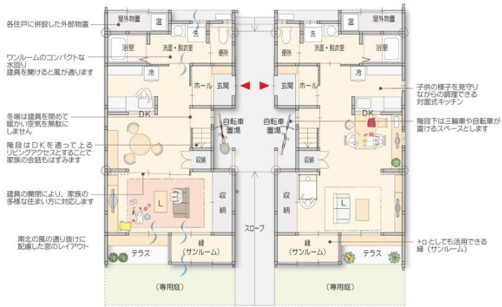
2LDK1階平面図 縮尺 1:100