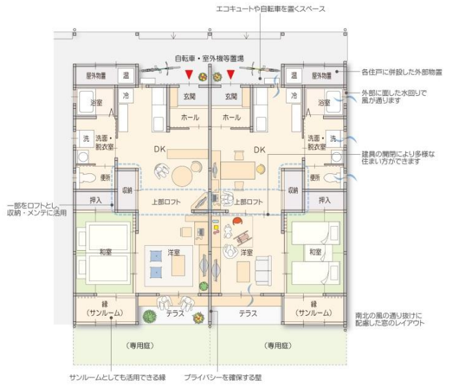
2DK1階平面図 縮尺 1:100