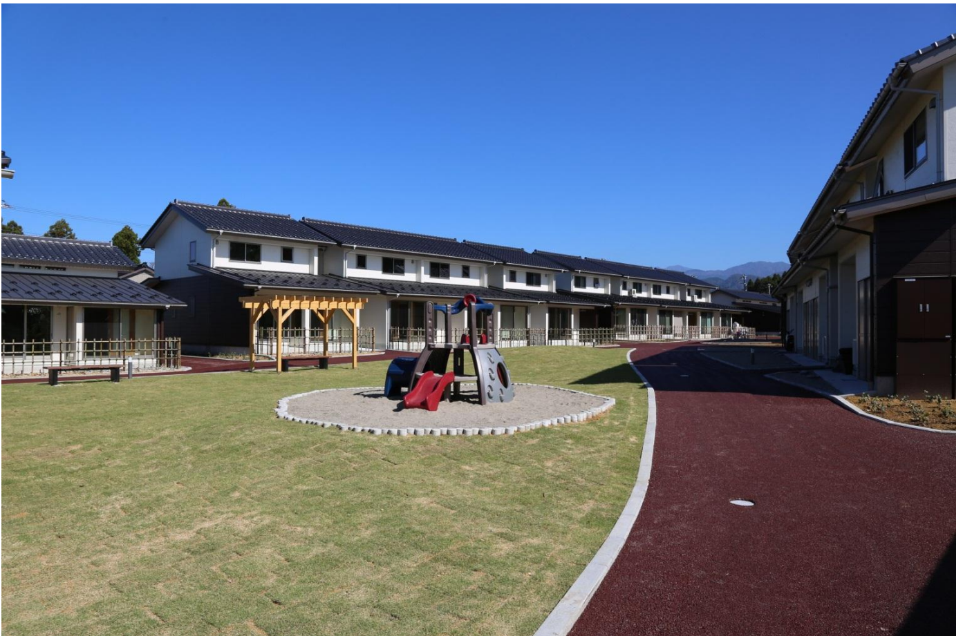
▲ 子供達を見守りやすいよう、児童遊園を囲むように公営住宅と集会場を配置